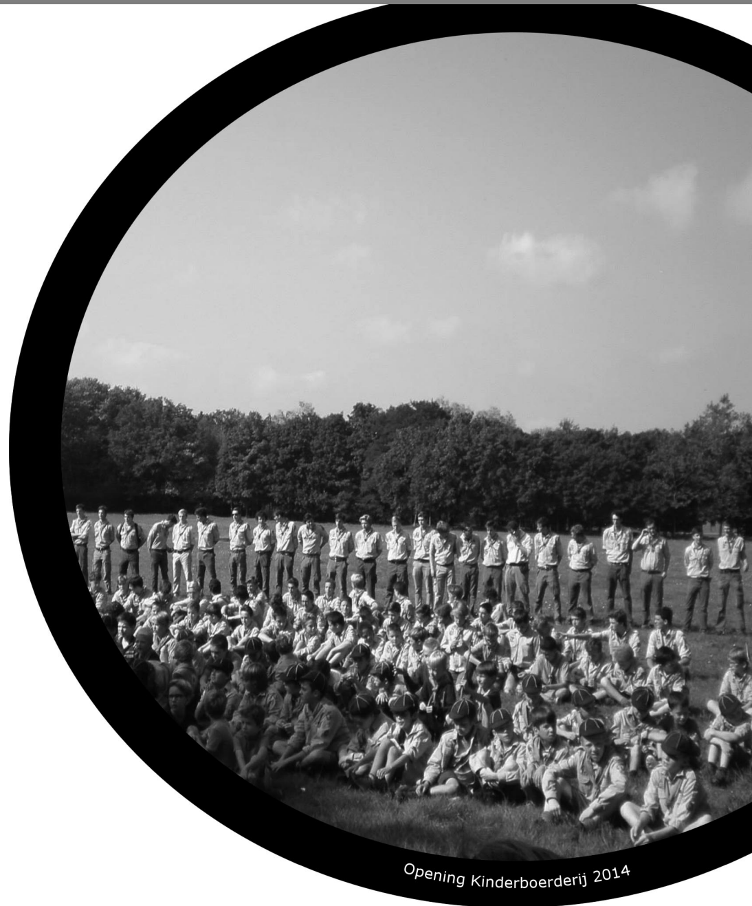
Opening Kinderboerderij 2014