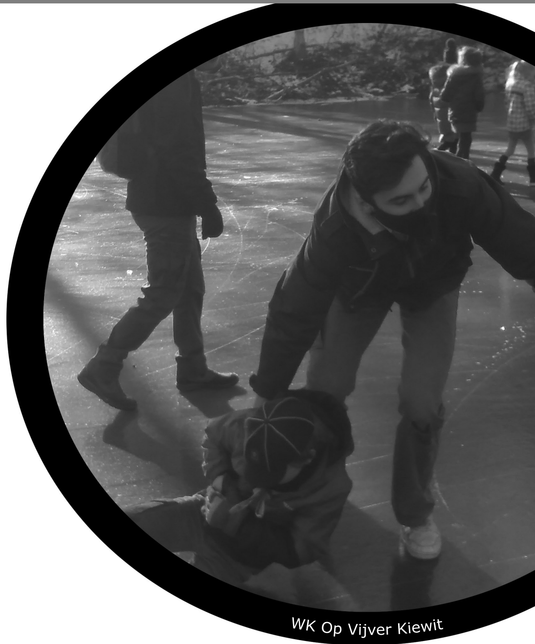
WK Op Vijver Kiewit